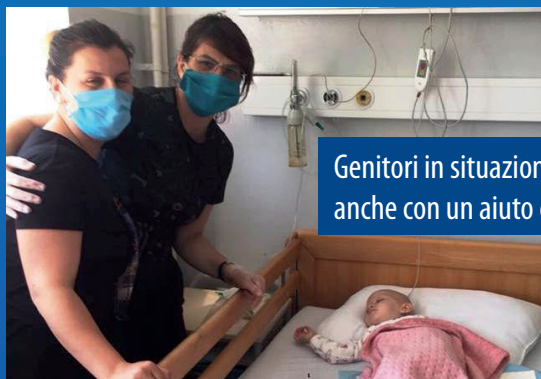
Genitori in situazioni di gravità sostenuti anche con un aiuto economico