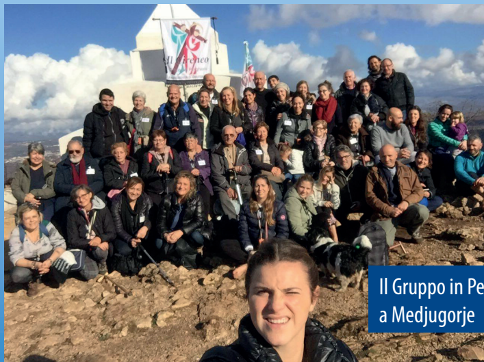
Il Gruppo in Pellegrinaggio a Medjugorje